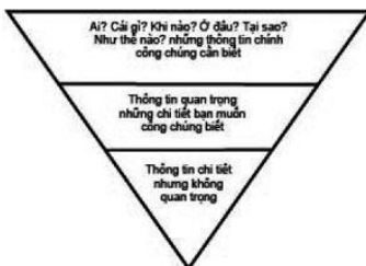
Mô hình kỹ năng viết cơ bản cho PR

Các bài PR được truyền tải đến công chúng mục tiêu thường thông qua các phương tiện thông tin đại chúng hoặc các bản tin nội bộ. Kỹ năng viết các bài PR, đặc biệt là thể loại thông cáo báo chí, phải viết như tin tức báo chí. Mỗi câu chữ trong bài viết phải cân nhắc để thu hút được sự quan tâm của công chúng, nếu không hấp dẫn thì công chúng sẽ thờ ơ với thông tin của bạn. Chính vì vậy, một kỹ năng viết tin truyền thống thường được sử dụng trong viết thông báo cáo chí và các thể loại khác của hoạt động PR là mô thức hình tháp ngược. Trong mô thức này, những thông tin, dữ kiện quan trọng được đưa lên trước. Bắt đầu với điểm chính, mở rộng với nhiều thông tin và chi tiết hơn theo thứ tự giảm dần mức độ quan trọng. Khi chỉ mới xem một phần thông tin, độc giả đã nắm được các nội dung, ý tưởng cơ bản.